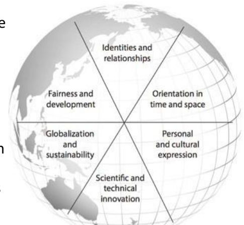
De MYP Global Contexts

De zes MYP Global Contexts inspireren leerlingen zich te verdiepen in lokale, nationale en mondiale samenlevingen en te reflecteren op real world problemen. Leerlingen verkennen alle zes Global Contexts bij alle vakken en in verschillende onderwerpen.