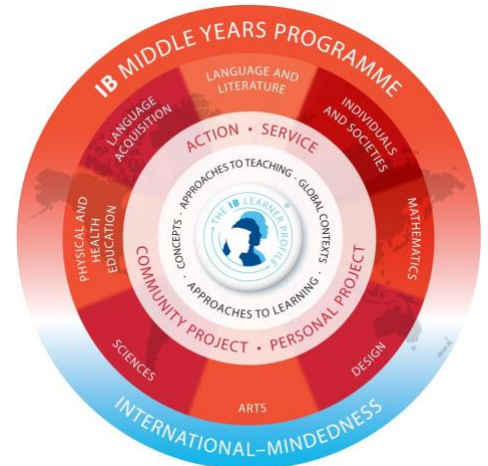
Het MYP curriculum model